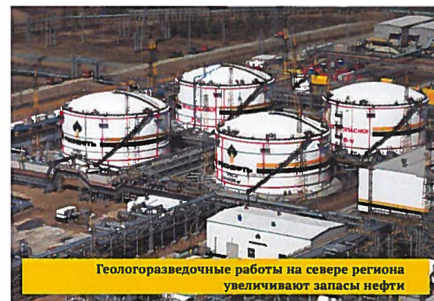
Геологоразведочные работы на севере региона увеличивают запасы нефти

Всего в 2016 году запланировано проведение сейсморазведочных работ 3D в объеме 1 079 кв. км, поисково-разведочное бурение – в объеме 7 800 м.