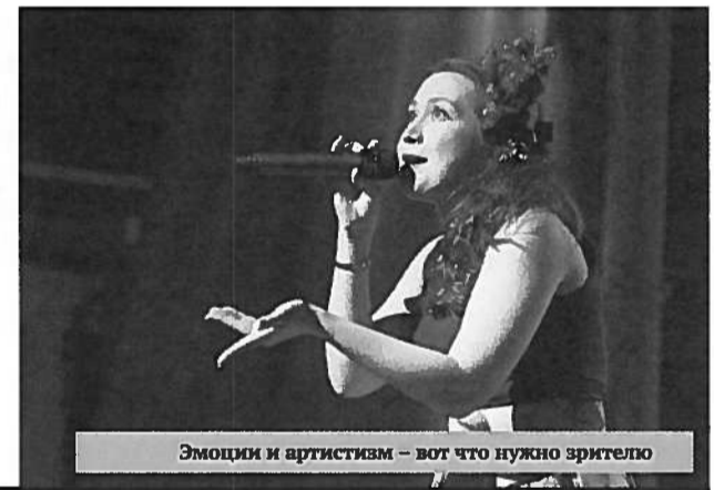
Эмоции и артистизм – вот что нужно зрителю